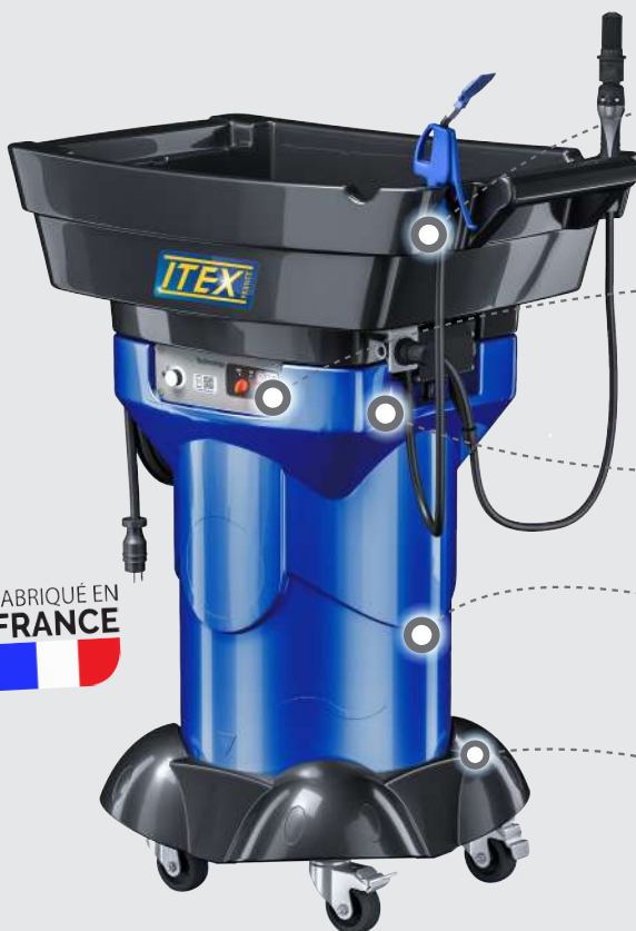
TABLE DE NETTOYAGE ERGONOMIQUE

Coûts d'entretien et de maintenance limités.